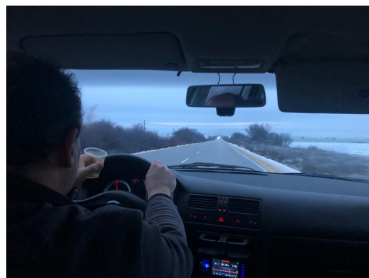
En route pour Pavlikeni

Ce dernier ne nous appartient pas, mais l'affaiblissement de ma santé nous rappelle au besoin de renforts. Plus que jamais il est nécessaire de supplier le Maître de la moisson de susciter des vocations dans son champ.